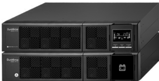
1/2/3 кВА XL*